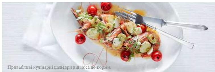
Привабливі кулінарні шедеври від носа до корми.