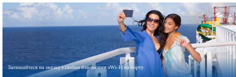
Залишайтеся на зв'язку з своїми близькими з Wi-Fi на борту.