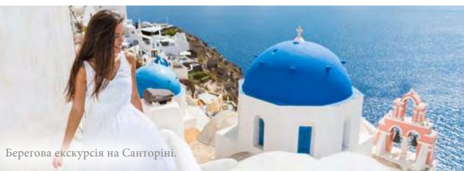
Берегова екскурсія на Санторіні.