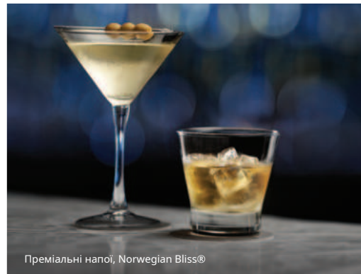
Преміальні напої, Norwegian Bliss®