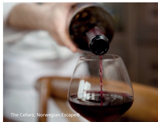
The Cellars, Norwegian Escape®