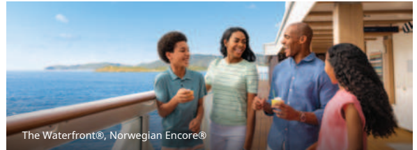
The Waterfront®, Norwegian Encore®

У деяких круїзах. Круїзи відповідно позначені в системах бронювання. Ви також знайдете огляд круїзів на ncl.com/more-at-sea . Якщо у бронюванні 5–8 гостей, ці гості повинні будуть сплатити звичайні тарифи.