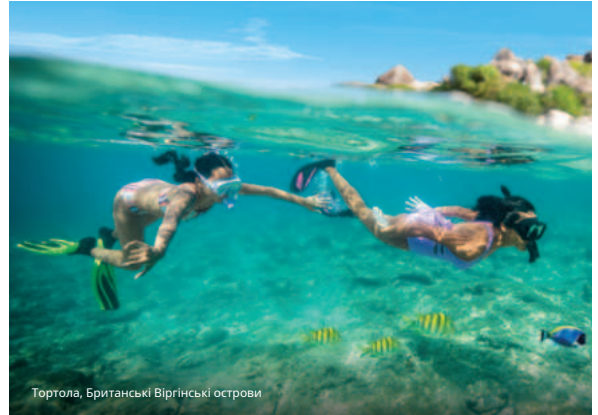
Тортولا, Британські Віргінські острови

Знижка 50 доларів США на каюту та екскурсію. Знижка завжди нараховується першій особі в каюті. Також включено порти висадки. Знижка автоматично застосовуватиметься до гостя 1 у бронюванні, якщо берегові екскурсії заброньовано через механізм бронювання агента, ncl.com або наш кол-центр. Бронювання повинні мати статус BK (підтверджено), щоб забронювати берегові екскурсії. Знижка в розмірі 50 доларів США буде автоматично конвертована в місцеву валюту. Будь-які берегові екскурсії вартістю менше 50 доларів США отримають 100% знижку, знижуючи ціну до нуля. Оренда на Great Stirrup Cay/ Harvest Caye не включена. Порти посадки також не включені. Знижка не підлягає передачі та не може бути сумована для використання в окремих портах. Можна використовувати під час кількох берегових екскурсій в одному порту.