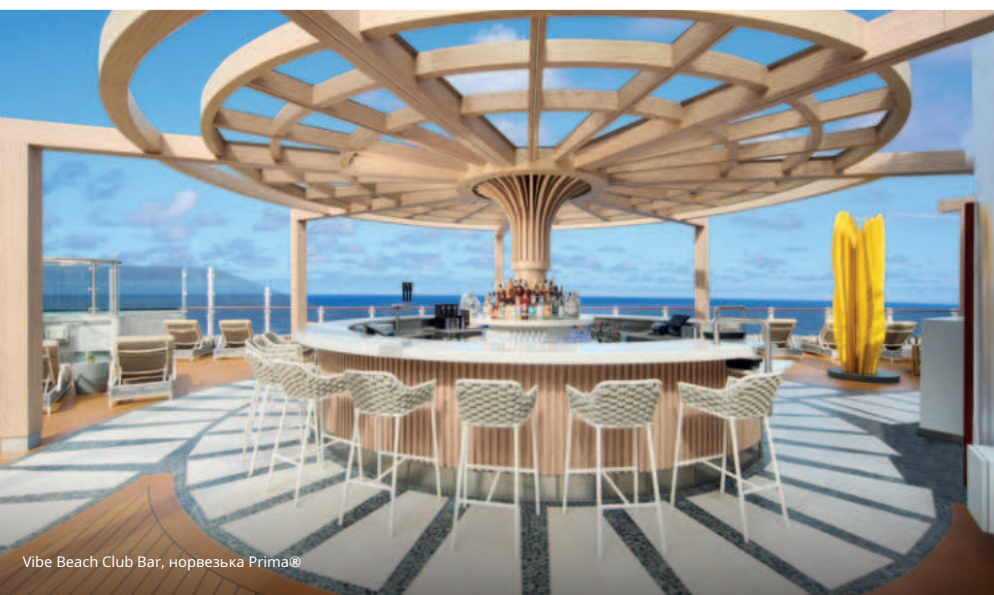
Vibe Beach Club Bar, норвезька Prima®