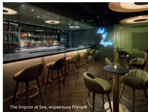
The Improv at Sea, норвезька Prima®