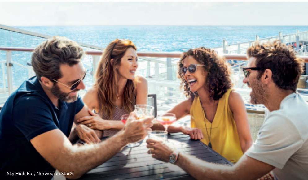
Sky High Bar, Norwegian Star®

TheБільше на морі-Пакет напоїв(дійсний для всіх дорослих у каюті) включає широкий вибір фірмових безалкогольних напоїв, пива, міцних алкогольних напоїв, коктейлів, вина в келихах, а також пляшкового або розливного пива протягом усього круїзу. Гості мають право на 2 напої на особу за транзакцію. Пакет можна використовувати в бортових ресторанах, лаунжах, барах і на острові Great Stirrup Cay. Винятком є лише напої з колекції Connoisseur Collection, напої в пляшках та спеціальні сорти кави. Вибір напоїв може відрізнятися залежно від корабля та пункту призначення.