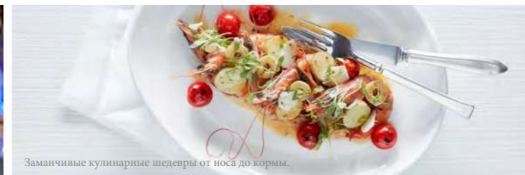
Заманчивые кулинарные шедевры от носа до кормы.