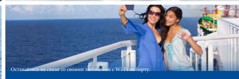
Оставайтесь на связи со своими любимыми с Wi-Fi на борту.